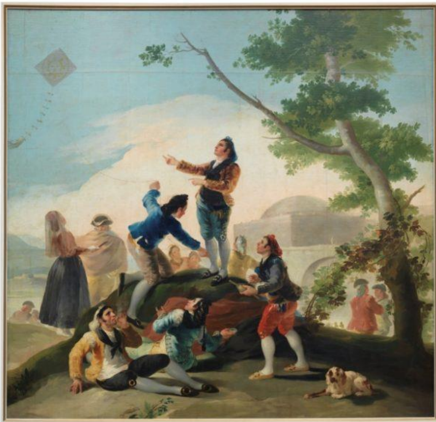
Ο Χαρταετός ( La Cometa ), έργο του Ισπανού ζωγράφου Francisco Goya, που χρονολογείται γύρω στο 1777 και σήμερα βρίσκεται στο Μουσείο του Πράδο, στη Μαδρίτη.

Οι ανατολικοί λαοί τους έδωσαν ζωντανές μορφές (ψάρια, πουλιά, δράκοντες κ.λπ.). Άλλοι έδεναν σ' αυτούς, γραμμένες πάνω σε μικρότερο χαρτί, τις αρρώστιες και τις συμφορές και τις άφηναν να φύγουν μακριά, άλλοι έστελναν προς τα επάνω τις ευχές και τις επιθυμίες τους, και άλλοι προσάρμοζαν μικρές φλογέρες στο κεφάλι του αετού, για να σφυρίζουν και να διώχνουν τα κακά πνεύματα. Τέλος, άλλοι σήκωναν ομαδικά τους αετούς, σαν προσευχή στον ουρανό και έψαλλαν ύμνους.