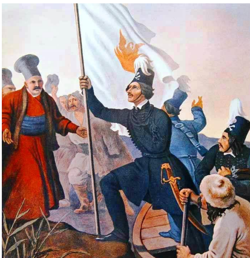
Ο Αλ. Υψηλάντης υψώνει τη σημαία της Επανάστασης στην Μολδοβλαχία.

Και κάθε χρόνο στις 25 Μαρτίου - και ειδικά τη φετινή 25η Μαρτίου με την επέτειο των 200 ετών - σκέφτομαι τους αδελφούς Υψηλάντη: τι έδωσαν, τι αισθάνθηκαν και τι ονειρεύτηκαν για να την πραγματοποιήσουν.