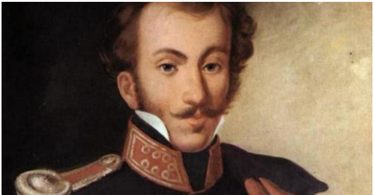
Ο Δημήτριος Υψηλάντης.

Οι καρδιές μας, όπως των αδελφών Υψηλάντη και των άλλων Ελλήνων επαναστατών, παραμένουν χωρίς καμία απολύτως αμφιβολία ελληνικές.