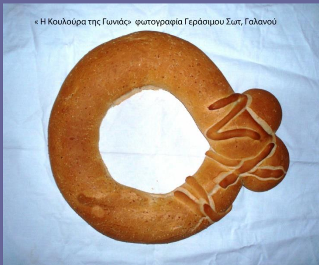
« Η Κουλούρα της Γωνιάς »

Η μητέρα έφερνε την κουλούρα . Ο πατέρας τη χάραζε σε κομμάτια, όσα και τα άτομα του σπιτιού, μετά έπαιρνε λάδι και κρασί και τα έριχνε σταυρωτά στη φωτιά μέσα από την τρύπα της κουλούρας, ψέλνοντας το Απολυτίκιο των Χριστουγέννων .